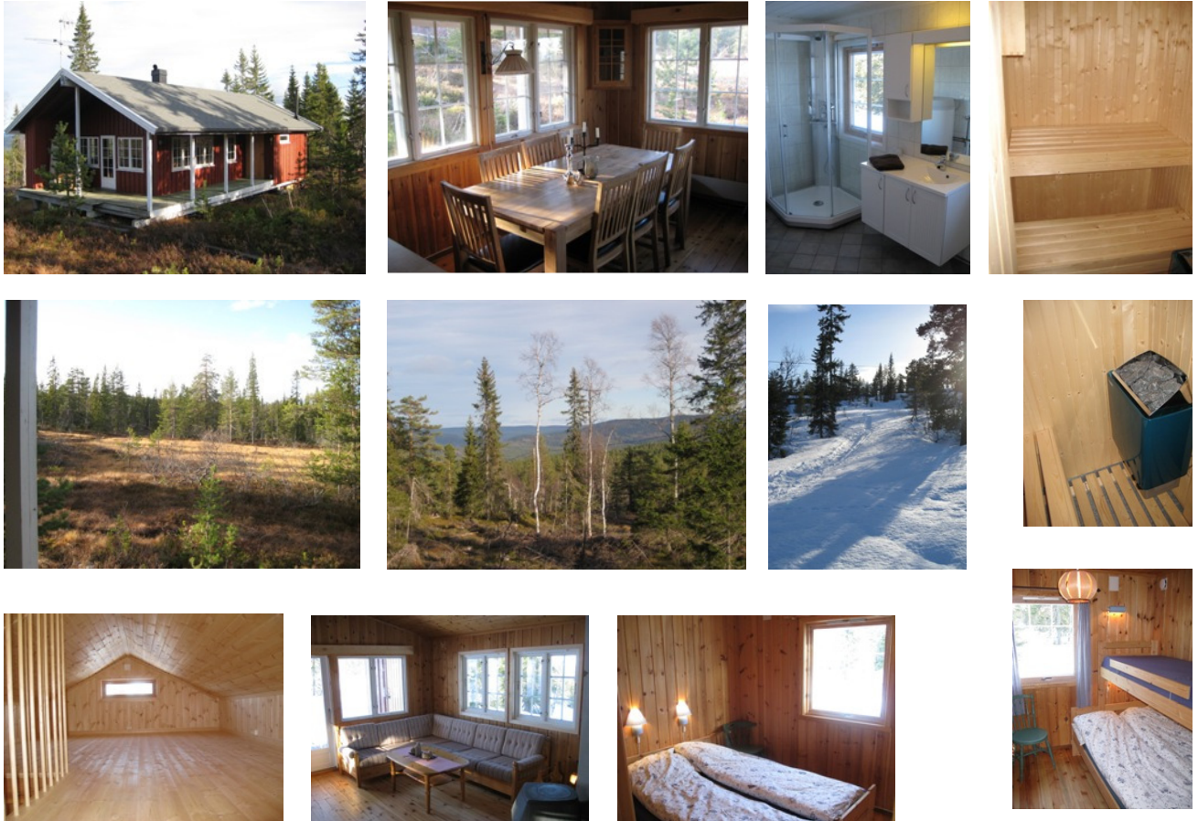
Bilder fra hytta og området rett på utsiden.